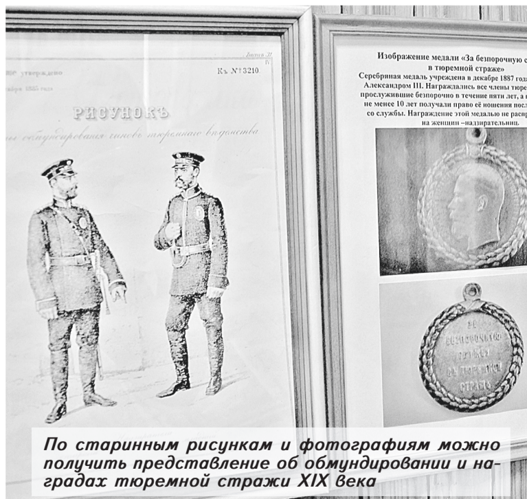
По старинным рисункам и фотографиям можно получить представление об обмундировании и наградах тюремной стражи XIX века