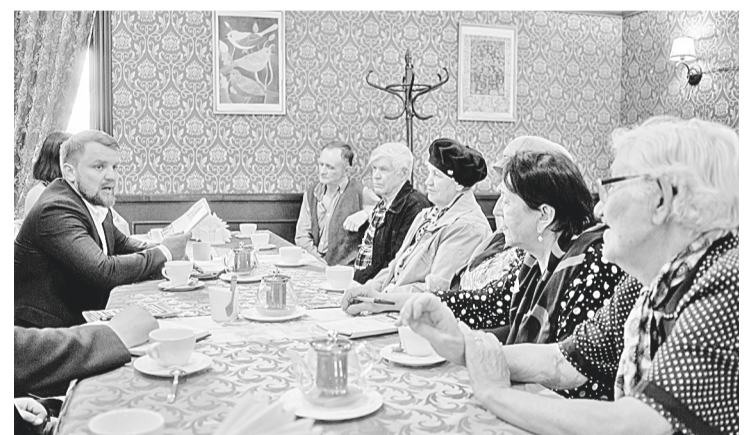
На встрече с представителями Боровичского совета ветеранов