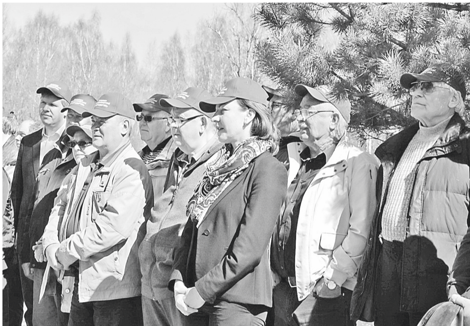
Торжественное построение перед началом праздника

Одними из главных задач Ассоциации были и есть защита интересов товаропроизводителей, сотрудничество бизнеса и власти в решении проблем промышленного, технического, социального характера, а также укрепление связей между учреждениями и предпринимательством.